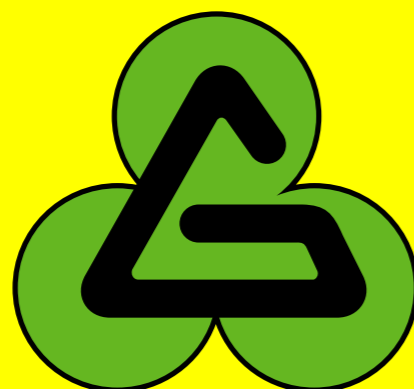
協会のシンボルマーク